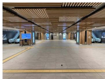
JR 松山駅 左から駅舎西側、1階コンコース、改札内中二階