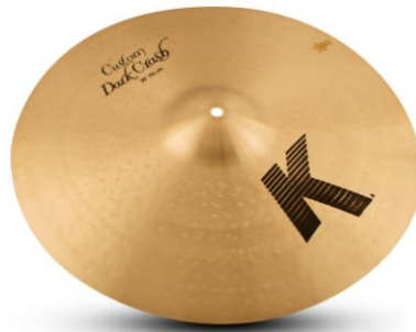
K カスタム ダーククラッシュ 20"

ジルジャン社（本社：USA）より認定を受けた国内総輸入販売元である株式会社ヤマハミュージックジャパン（本社：東京都港区、代表取締役社長：土井好広）は、シンバルの新製品として、K カスタムシリーズより大口径の 19 インチ、20 インチを発売します。また、ドラムスティックとバッグも同時発売します。