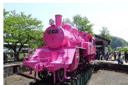
昨年のピンクSLの様子