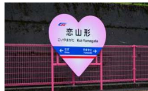
ハート型の駅名標

※「恋駅プロジェクト」とは…駅名に「恋」がつく鉄道会社4社（JR北海道「母恋駅」、三陸鉄道「恋し浜駅」、西武鉄道「恋ヶ窪駅」、智頭急行「恋山形駅」）が連携して地域活性化を図る目的で立ち上げたプロジェクトのことです。