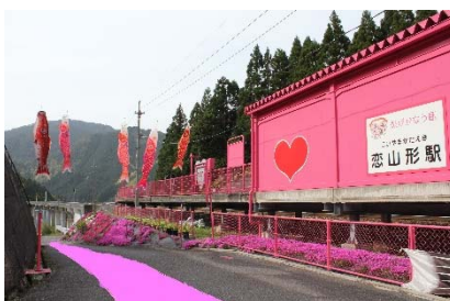
恋ロード(イメージ)