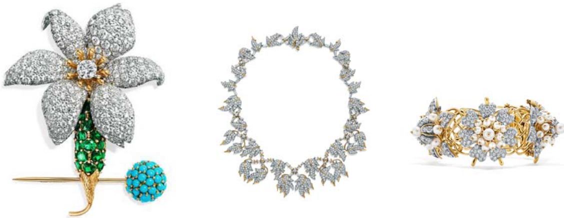
Jean Schlumberger Jewelry Collection