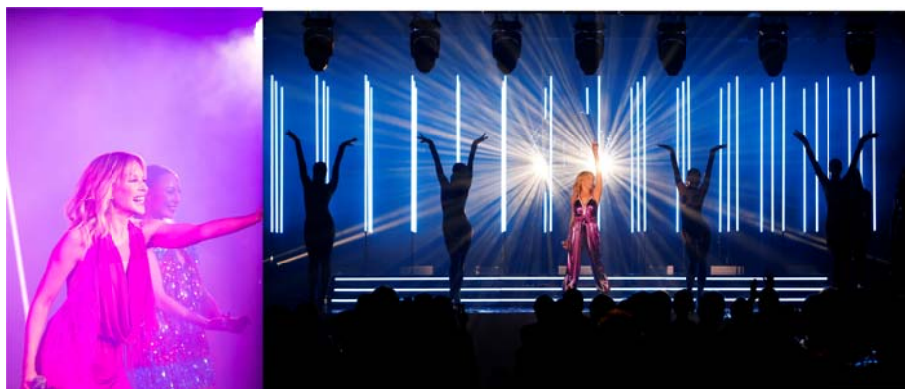
Musical Performance by Kylie Minogue