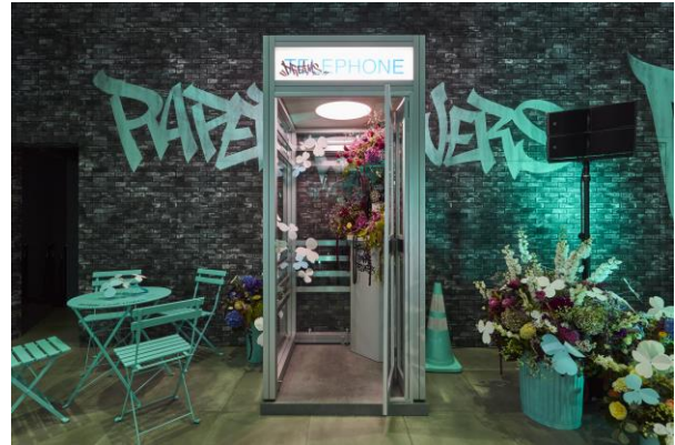
ニューヨークの街並みを再現した地下鉄や電話ボックスのセット

#TiffanyPaperFlowers #TiffanyBlue @tiffanyandco