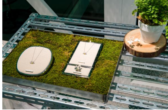
グリーンハウス内にディスプレイされた新作「ティファニー ペーパーフラワー」コレクション