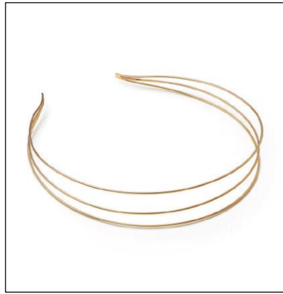
【左】エルサ・ペレッティ セビアナ カフ（左からスターリングシルバー×ブラックジェイド、18K イエローゴールド×グリーンジェイド）【右】エルサ・ペレッティ ヘッドバンド（18K イエローゴールド）