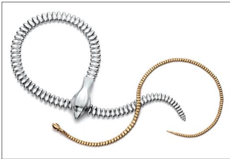
エルサ・ペレッティ スネーク ネックレス（左からスターリングシルバー、18K イエローゴールド）