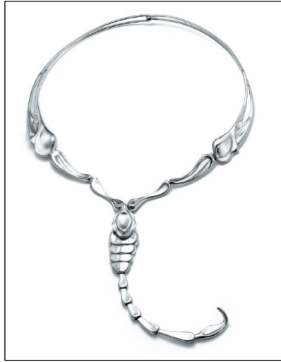
【左】エルサ・ペレッティ ボトル ペンダント (スターリングシルバー) 【右】エルサ・ペレッティ スコーピオン ネックレス (スターリングシルバー)