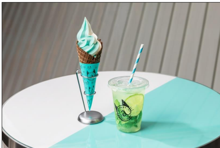
ティファニーカフェ@キャットストリート新メニュー ソフトクリーム¥500、ノンアルコールモヒート¥610※ともに税込