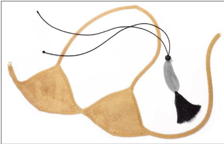
【左から】エルサ・ペレッティ メッシュ ホルター (18K イエローゴールド)、メッシュ ポーチ ペンダント (スターリングシルバー、シルクコード)