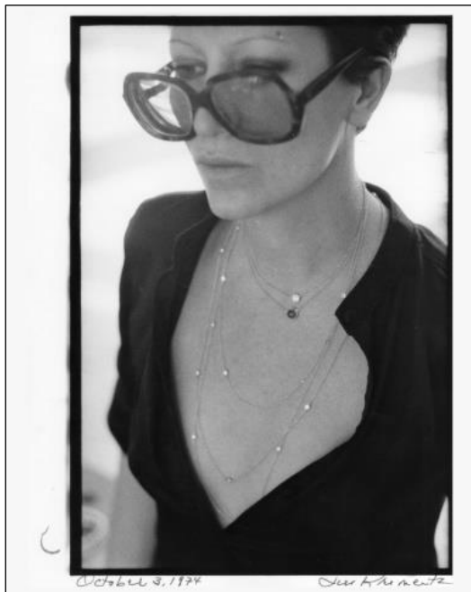
エルサ・ペレッティ