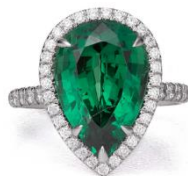
エメラルドリング