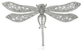
ドラゴンフライブローチ