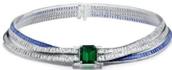
エメラルドネックレス