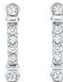
ティファニーフルールドリス ステムピアス