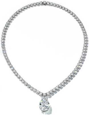
ダイヤモンドペンダント