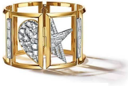
ダイヤモンドブレスレット