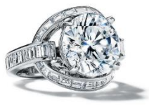
ダイヤモンドリング