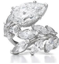
ダイヤモンドリング