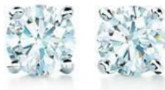
ティファニー ソリティア ダイヤモンド ピアス