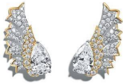
ティファニー シュランパーゼ® リボンファンイヤリング