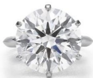
ダイヤモンドリング