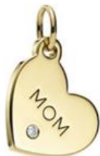
ティファニー チャーム Mom タグ 74,000円(税別)

熟練の職人によって生まれた、美しい輝きを放つティファニーのダイヤモンド。永遠と輝き続けるダイヤモンドジュエリーを添えて、日々の感謝の気持ちを伝えてみませんか。