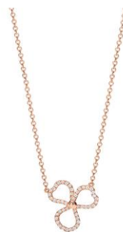
ティファニー ペーパーフラワー ダイヤモン ド オープン フラワー ペンダント 220,000円 (税別)