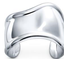
エルサ・ペレッティ™ ボーンカフ (ス モール) 125,000円(税別)