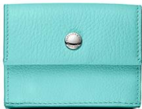
コンパクト レザー ウォレット 56,000円(税別)

幸せを運ぶ鳥として知られる“こまどり”の卵からインスパイアされたティファニーブルー。上質な素材にティファニーブルーを斬新に取り込んだアイテムは、毎日をスペシャルな時間へと生まれ変わらせてくれます。