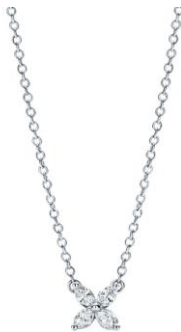
ティファニー ビクトリア™ ペンダント 260,000円(税別)