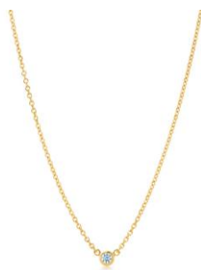
エルサ・ペレッティ™ ダイヤモ ンド バイ ザ ヤード™ ペンダ ント 0.05カラット 77,000円(税別)