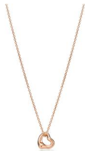
エルサ・ペレッティ™ オー ブン ハート ペンダント 55,000円(税別)

ジュエリーの新時代を築いてきたデザイナー、エルサ・ペレッティ。彼女が手掛けたアイコンアイテムは、いつの時代も世界中の女性から愛され続けています。永遠に輝き続ける最愛の母へ、ティファニーからタイムレスな贈り物はいかがですか。