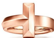
ティファニー Tワン ワイドリング 235,000円(税別)