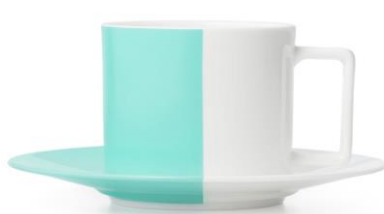
カラーブロック ティーカップ & ソーサー 10,500円(税別)