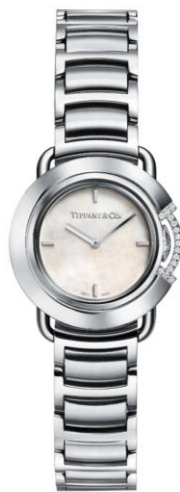
ティファニーTウォッチ 限定エディション

[ケース径25mm ステンレススチール ラウンドケース ホワイトマザーオブパール クォーツ式]