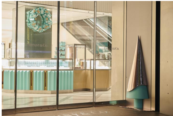
ティファニー銀座本店エントランスにデザインされた、クリスマスツリー

ショーウィンドウのなかで展開するのは、わくわくが止まらないクリスマスツリーや積み上げられたギフトボックス、雪のモチーフといったシーン。ツリーはローズゴールドで包まれ、ブルーボックスにはローズゴールドのリボンが巻かれています。セレブレーションムードに溢れたショーウィンドウは、全ての方に幸せと喜びを伝え、ティファニーが贈るホリデーの世界観へと誘います。