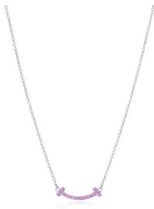
ティファニーTスマイル ミニペンダント

自由や幸福、愛情、強さを体現したブランドを象徴するアイコン的な「ティファニー T」コレクションより、2スタイル個数限定にて展開。この特別な新作は、大切な人への贈り物にはもちろん、今年一年の終わりにご自身へのご褒美にもおすすめです。