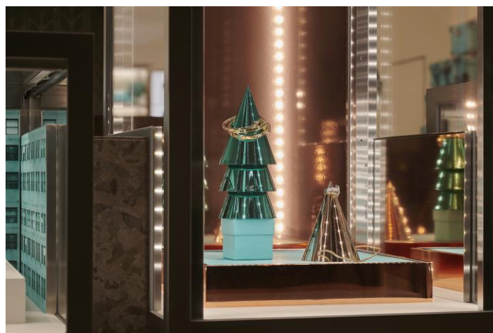
ホリデーの商品ディスプレイ