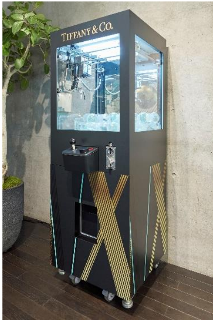
1F 期間限定で設置されるクレーンマシーン