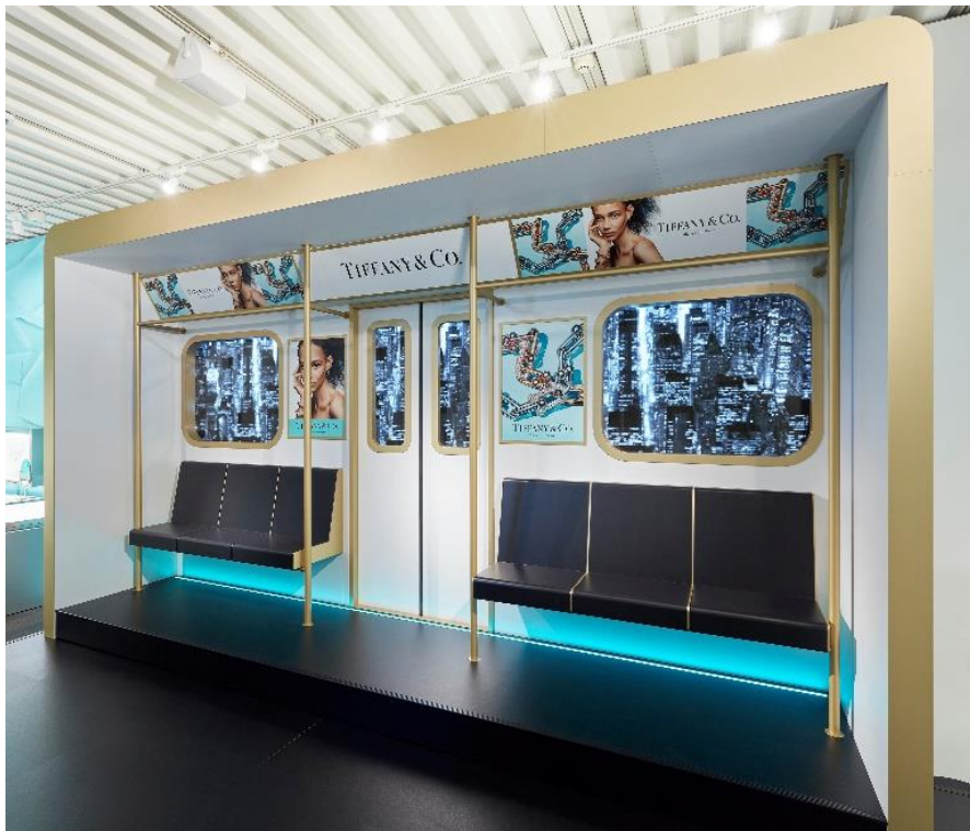
BIF ニューヨークのサブウェイを模したフォトスポット

この記念すべき2周年を祝し、4月23日（金）より「NY loves Tokyo」というコンセプトのもと、店内ではニューヨークの街からインスピレーションを得たユニークなコンテンツやサービスを展開。ニューヨークのサブウェイや、ラグジュアリーなクレーンゲーム、ニューヨークと東京の街並みをイメージしたフォトスポットなど、この期間だけの特別な世界観をご堪能いただけます。