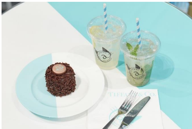
期間限定のカフェメニュー

さらに、「ティファニーカフェ@キャットストリート」では、期間限定の新メニューも登場いたします。