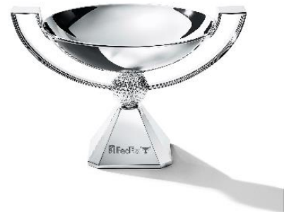
PGA®ツアー・フェデックスカップ・トロフィー