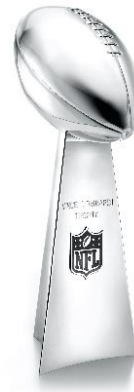
ヴィンス・ロンバルディ・トロフィー