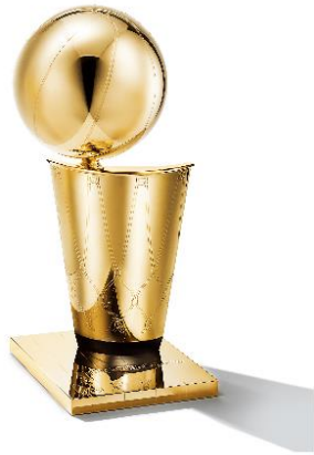
ラリー・オブライエン・チャンピオンシップ・トロフィー

そして今回特別に展示される、スポーツにおける偉業を称える最も有名なシンボルの数々。NBA®ファイナルの優勝チームに贈られる『ラリー・オブライエン・チャンピオンシップ・トロフィー』、NFL®スーパーボウルの優勝チームに贈られる『ヴィンス・ロンバルディ・トロフィー』、テニスの全米オープンにて男子・女子各シングルス優勝者に贈られる『USオープン・トロフィー』、PGA®ツアー・フェデックスカップのシーズン選手権の優勝者に授与される『PGA®ツアー・フェデックスカップ・トロフィー』、そしてティファニーの歴史を物語るチャンピオンシップリングの数々が一堂に会します。