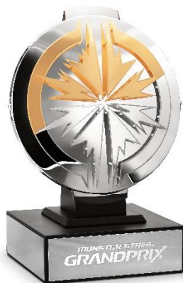
『モンスターグランプリ』トロフィー

さらに今年ティファニーは、日本で人気を誇るスマホアプリ『モンスターストライク』のために、ブランド史上初となるeスポーツトロフィーを制作。ティファニーのクラフトマンシップにおける新たなレガシーを刻む本トロフィーも、期間中特別に展示されます。