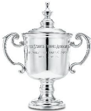
USオープン・トロフィー