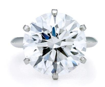
ティファニー® セッティングリング センターストーン 10.14ct