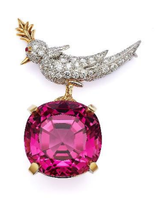
「バードオンアロック」プローチ ルベライト 49.82ct