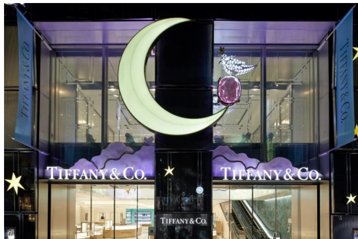
ジャン・シュランバージェの代表作「バード オンア ロック」ブローチが施された銀座本店ファサード