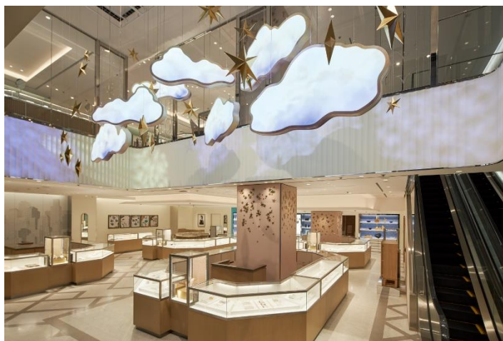
ジャン・シュランバージェの幻想的な世界観が表現された店内