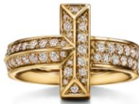
ティファニー T ワン リング 18K イエローゴールド、ダイヤモンド ¥770,000 (税込)