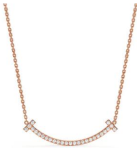
ティファニー T スマイル ペンダント (ミディアム) 18K ローズゴールド、ダイヤモンド ¥731,500 (税込)

モダンでありながらタイムレスな美を具現化し、幸せの象徴である笑顔を表現する、「T スマイルペンダント」。きらめきを放つダイヤモンドがちりばめられ、優美な曲線がエレガントな存在感を放ちます。また今年のホリデーシーズンに日本限定で販売中のペンダントは、虹色に艶めくマザーオブパールを、ローズゴールドのサークルペンダントにあしらったモダンなデザインが特徴です。