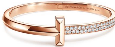
ティファニー T ワン ヒンジ バングル 18K ローズゴールド、ダイヤモンド ¥2,695,000 (税込)

アイコン的なブランドイニシャルの“T”を再構築し、グラフィカルなデザインが特徴の「ティファニーTワン」コレクション。エッジにカットを施し、精巧で力強いイニシャルのデザインが中央にあしらわれたバングルやリングにティファニーが誇るダイヤモンドが贅沢にあしらわれています。