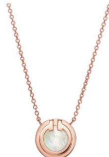
ティファニー T ツー マザーオブパール サークル ペンダント 18K ローズゴールド、マザーオブパール ¥157,300 (税込)