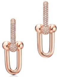
ティファニー ハードウェア リンク ピアス 18K ローズゴールド、ダイヤモンド ¥1,705,000 (税込)