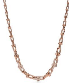
ティファニー ハードウェア グラジュエイトッド ネックレス 18K ローズゴールド、ダイヤモンド ¥7,425,000 (税込)

ニューヨークのスピリットに着想を得た「ティファニー ハードウェア」コレクションからは、大胆でボリュームのあるゲージリンクが特徴のネックレス、ピアスとブレスレット。ニューヨークの都会的で洗練された雰囲気をつめた力強いデザインが魅力です。