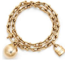
ティファニー ハードウェア ラップ ブレスレット 18K イエローゴールド ¥1,199,000 (税込)

こちらのアイテムはすべて、ティファニーの公式オンラインストアにてお求めいただけます。大切な方へのギフトにも、ティファニーブルーボックスに白いサテンリボンをかけてお届けします。