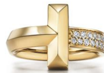
ティファニー T ワン リング 18K イエローゴールド、ダイヤモンド ¥511,500 (税込)

モダンでありながらタイムレスな美を具現化し、幸せの象徴である笑顔を表現する、「T スマイルペンダント」。きらめきを放つダイヤモンドがちりばめられ、優美な曲線がエレガントな存在感を放ちます。また今年のホリデーシーズンに日本限定で販売中のペンダントは、虹色に艶めくマザーオブパールを、ローズゴールドのサークルペンダントにあしらったモダンなデザインが特徴です。