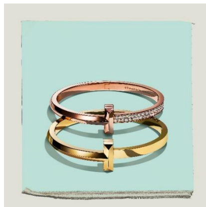
上：ティファニー Tワン ヒンジ バングル 18K ローズゴールド、ダイヤモンド ¥2,970,000-税込 下：ティファニー Tワン ワイド ヒンジ バングル 18K イエローゴールド ¥880,000-税込