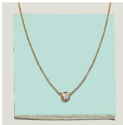
エルサ・ペレッティ™ ダイヤモンド バイザード™ シングル ダイヤモンド ペンダント 18K イエローゴールド、ダイヤモンド 0.18 カラット～ 20 万円台～