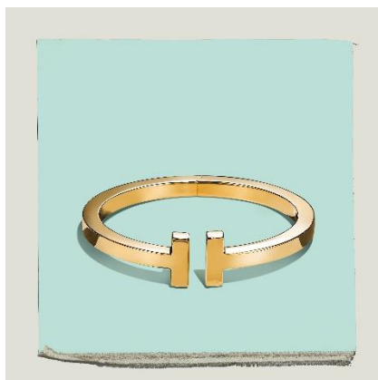
ティファニー T スクエア プレスレット 18K イエローゴールド ¥808,500-税込