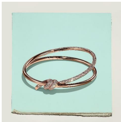
ティファニー ノット ダブル ロウ ヘンジ バングル 18K ローズゴールド、ダイヤモンド ¥2,970,000-税込