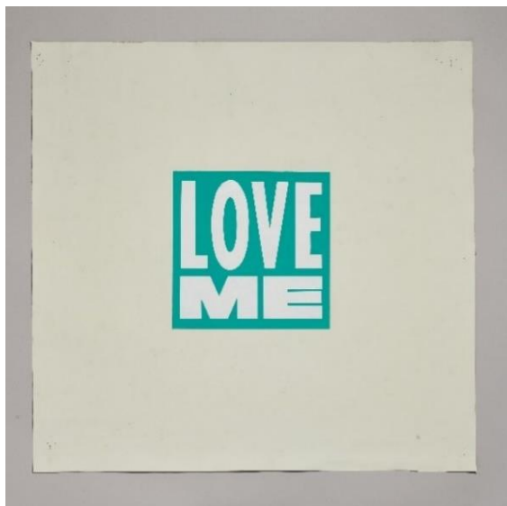
© 2022 Tiffany and Company. ® & © 2021 Curtis Kulig

ティファニーは、2022年の日ヴァンタインデーキャンペーンとして、アーティストのカーティス・クリグ (Curtis Kulig) とのコラボレーションを発表いたしました。ニューヨークを拠点に活躍するクリグは、筆記体で書かれた「Love Me」のアイコンで一躍脚光を浴びました。「ブルー・イズ・ザ・カラー・オブ・ラブ」と名付けられたクリエイティブなパートナーシップは、ティファニーが革新的で創造性豊かなアーティストたちと展開してきた多くのコラボレーションの中で、愛と約束をブランドのテーマの一つとして掲げるティファニーへのオマージュとなり、アート、言葉、そして愛そのものが持つ力を称賛するものです。