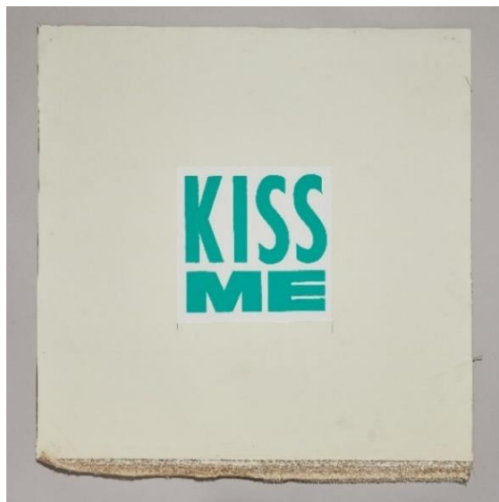
© 2022 Tiffany and Company. ® & © 2021 Curtis Kulig

「『Love Me』は私にとって非常にパーソナルなものとして構想され、それが自然に他の人の解釈へと発展していくのです。だからこそこの作品は面白いのです。」カーティス・クリグはこう述べています。また、今回のティファニーとのコラボレーションについて彼は、「ティファニーとのクリエイティブなプロセスはとても自然なものでした。」と説明しています。