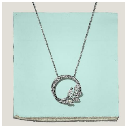
ティファニー ビクトリア™ ダイヤモンド ヴァインサークル ペンダント プラチナ、ダイヤモンド ¥1,144,000-税込