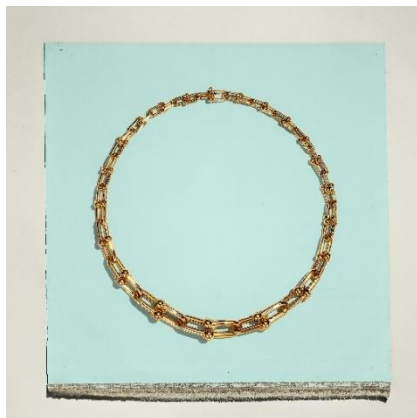
ティファニー ハードウエア グラジュエイトリンク ネックレス 18K イエローゴールド ¥1,958,000-税込

そして「ブルー・イズ・ザ・カラー・オブ・ラブ」キャンペーンでは、大切な人やご自身へのバレンタインデーのギフトとしてもお勧めの「ティファニーハードウエア」、「ティファニーT」、新作の「ティファニーノット」などのジュエリーコレクションとともに、クリグがティファニーのために制作したアートワークが展開されます。