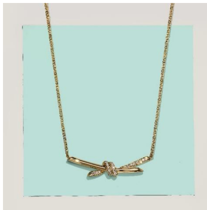
ティファニー ノット ペンダント 18K イエローゴールド、ダイヤモンド ¥528,000-税込