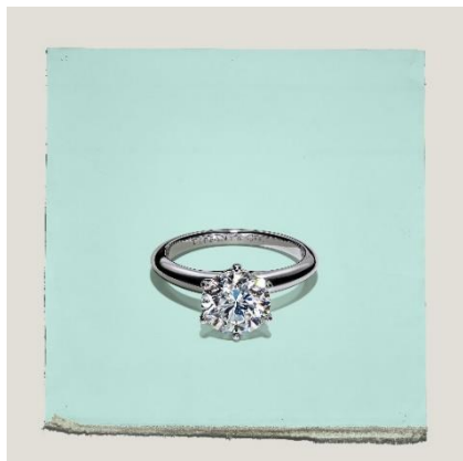
ティファニー® セッティング エンゲージメント リング プラチナ、ダイヤモンド 0.18 カラット～ 20 万円台～