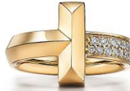
ティファニーTワンリング 18Kイエローゴールド、ダイヤモンド 539,000円(税込)