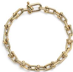
ティファニーハードウェア リンクブレスレット 18Kイエローゴールド 583,000円(税込)

ティファニーハードウェアは、2017年にデビューして以来、ティファニーを代表するジュエリーコレクションの一つです。ティファニーのアーカイブである1971年のブレスレットを基にしたアイコン的なゲージリンクとインダストリアルな形状は、ニューヨークのみなぎるパワーとエッジ、ストリート性を持つ反逆的なエネルギーへのオマージュを表現しています。