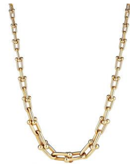
ティファニーハードウェア グラジュエイテッドリンクネックレス 18Kイエローゴールド 1,958,000円(税込)