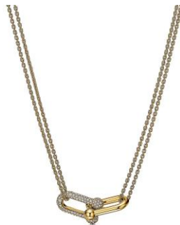
ティファニーハードウェアリンクペンダント 18Kイエローゴールド、ダイヤモンド 1,331,000円(税込)