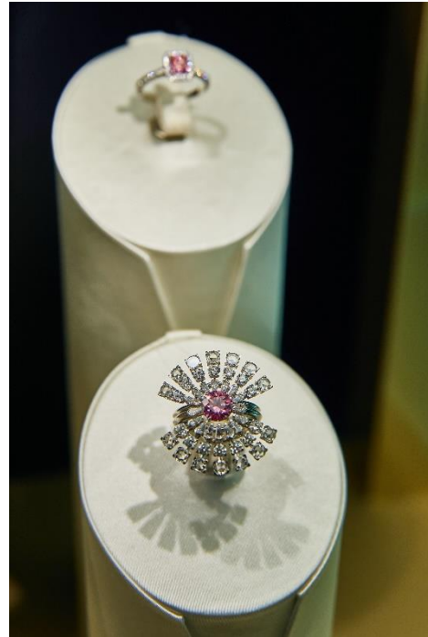
ファンシービッドパープリーッシュピンクダイヤモンドリング