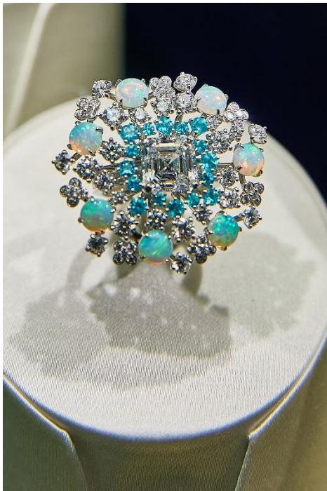
ダイヤモンドリング