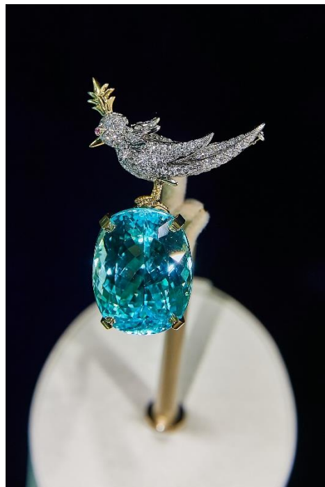
ジャン・シュランバージェバードオンアロックブローチ