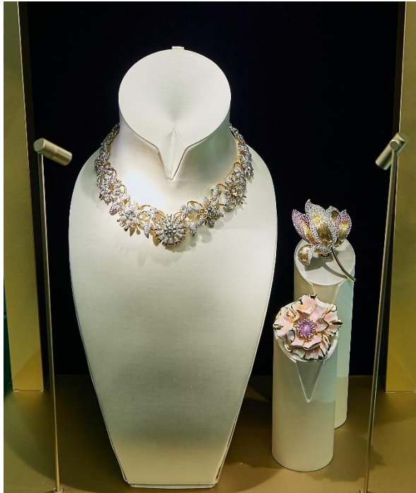
時計回りに：ネックレス