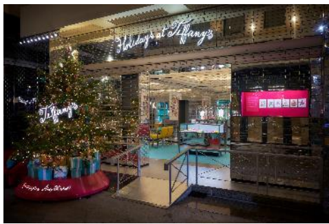
ポップアップストア