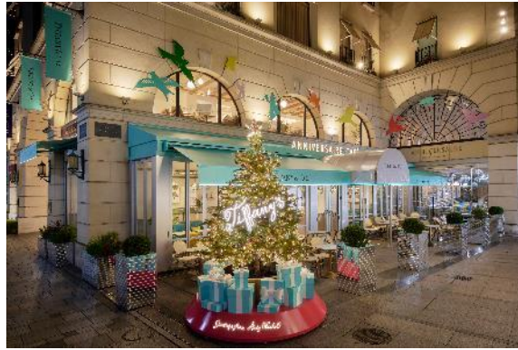
アンディ・ウォーホルからインスピレーションを受けたクリスマスツリーが飾られたファサード