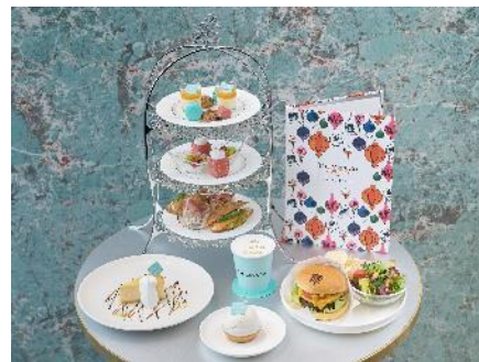
ブランドのロゴをラテアートで表現したスペシャルドリンクや サンドイッチ、ケーキなどの様々な限定メニュー