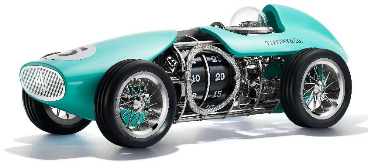
「タイムフォースピード」レーサークロック リミテッドエディション

アルミニウムにティファニーブルーの自動車用塗装、ダイヤモンド合計19.53カラット、ステンレススチール製のスポークとリム、耐摩耗性のゴム製タイヤ、運転席を囲むガラス製ドーム、サイズ約15.7cm×38.6cm×11.9cm、スイス製 30,745,000円税込