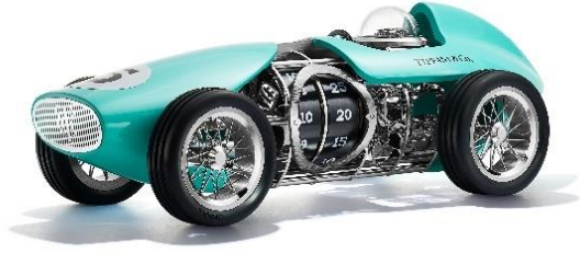
「タイム フォースピード」 レースカークロック スタンダードエディション 価格未定(日本では 2023 年発売予定)