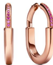
ティファニーロックロゼエディション ピアス ¥951,500(税込)