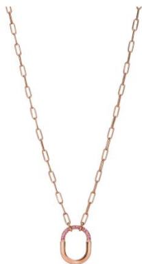
ティファニーロックロゼエディション ネックレス ¥506,000(税込)

「ティファニー ロック ロゼ エディション」は、「ティファニー表参道」で先行発売され、その後、中国、韓国、ニューヨークの本店で、10月1日に世界各国のティファニーストアにて順次展開いたします。