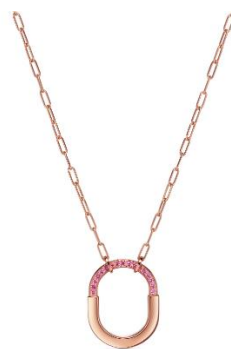
ティファニーロックロゼエディション ネックレス ¥924,000(税込)