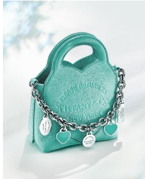
リターントゥティファニー™ マイクロチャームトートバッグ(ティファニーブルー) ¥225,500 (税込)

ティファニーは、アイコンックな4つのコレクションからホリデーシーズンを華やかに彩る日本限定商品を発表いたします。