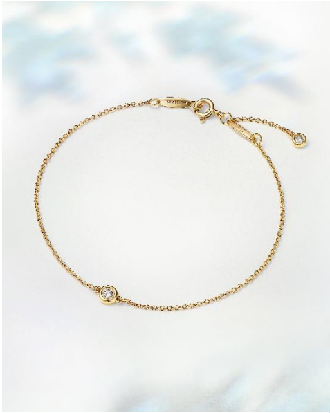
エルサ・ペレッティ™ ダイヤモンドバイザヤード™ プレスレット (18Kイエローゴールド、ダイヤモンド) ¥247,500 (税込)

ティファニー、アイコンックな4つのコレクションからホリデーシーズンを華やかに彩る日本限定商品を発表