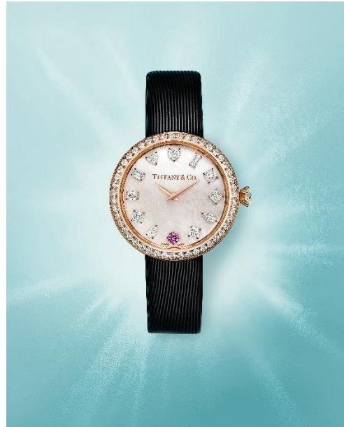
ティファニー エタニティ ウォッチ (18K ローズゴールド、ダイヤモンド、ピンクサファイヤ、 マザー オパール、サテン仕上げ カーフレザーストラップ、 ケース径 28mm、クォーツ式) ¥4,950,000 (税込)