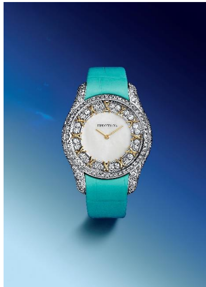
「ジャン・シュランバージェ バイ ティファニー」16 ストーン マザー オブ パール ウォッチ

デザインの遺産では、ティファニーの象徴的なスタイル—時代を超えた普遍性と革新的な創造性の調和—を讃えます。クリエイションの可能性を押し広げるティファニーは、20 世紀中頃のジュエリーの美学を築いた先見の明をもつデザイナー、ジャン・シュランバージェに敬意を表し、このテーマを体現しています。1959 年に誕生したアイコン的なジュエリーデザインに着想を得た「16 ストーン」コレクションは、彼の独創的なデザインの遺産を再解釈したものです。新作 36mm モデルは、艶めくマザー オブ パールの文字盤と、ダイヤモンドとゴールドのクロスステッチモチーフをあしらった象徴的な回転リングを特徴としています。