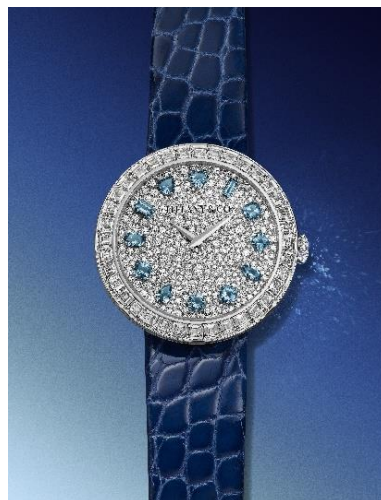
「ティファニー エタニティ」バゲット ウォッチ