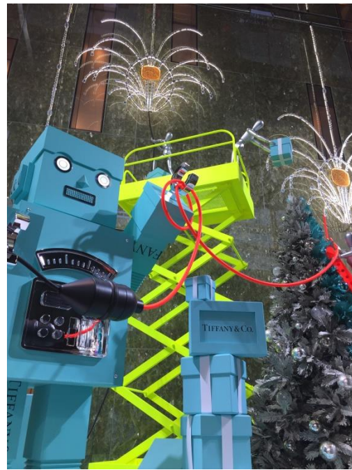
ティファニー銀座本店で展示中のホリデーディスプレイ

ティファニー銀座本店のエントランスには、大きなティファニーブルーのロボットとクリスマスツリーが登場。鮮やかなネオンカラーのハンゴに乗って、フィギュアたちがホリデーのディスプレイを始めます。この時期ならではの幸せな瞬間をフィギュアたちが演出します。