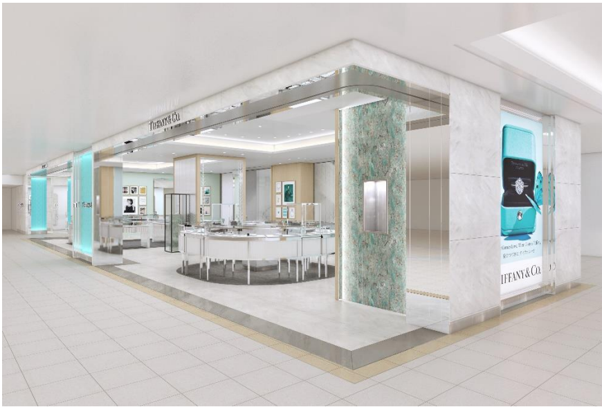
ティファニー博多阪急店 1階 店内 完成予想図

店名表記：ティファニー博多阪急店 1階 所在地：福岡県福岡市博多区博多駅中央街1-1 電話番号：052-432-1517 営業開始日：2020年09月26日（土） 売り場面積：約200㎡ 営業時間：10:00～20:00 休業日：不定休