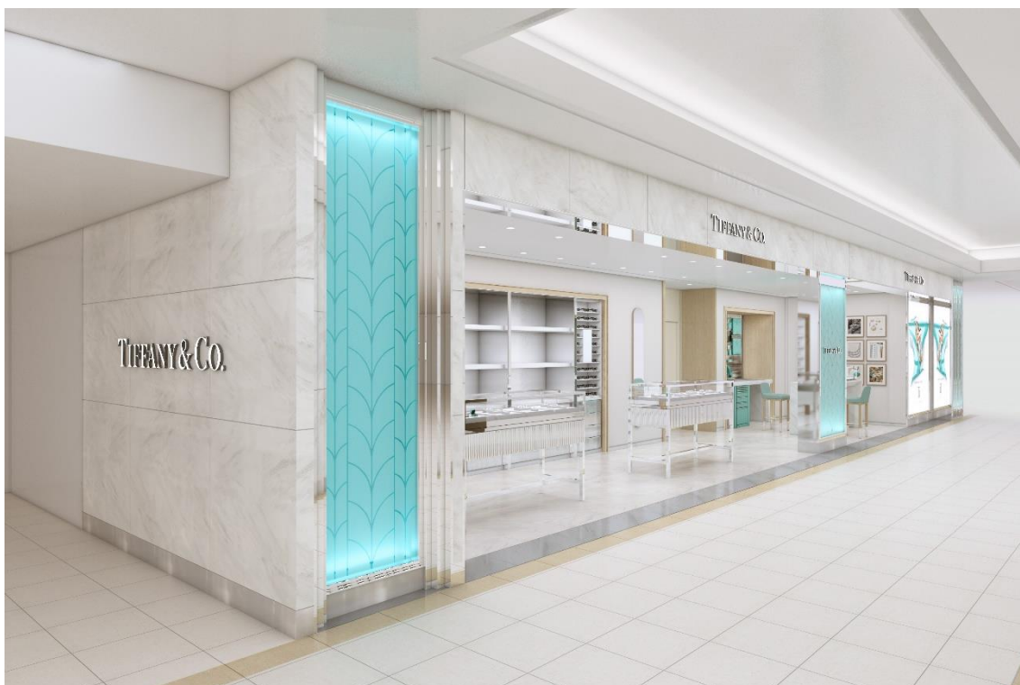
ティファニー博多阪急店 1階 店内 完成予想図