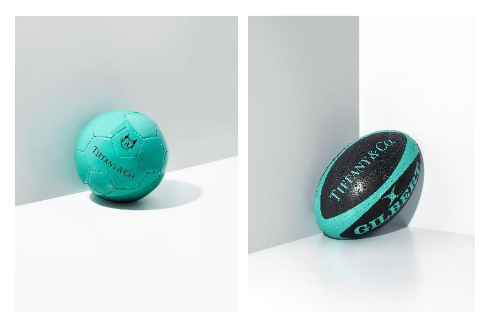
7月16日(金)発売:ティファニー x『スポルディング』サッカーボール ¥69,300-(税込) ティファニー x『ギルバート』ラグビーボール ¥69,300-(税込)

第一弾として発売となったバスケットボールに続いて、第二弾として7月16日(金)より『スポ ルディング』とのコラボレーションによるサッカーボールと、『ギルバート』とのコラボレーショ ンによるラグビーボールを発売いたします。