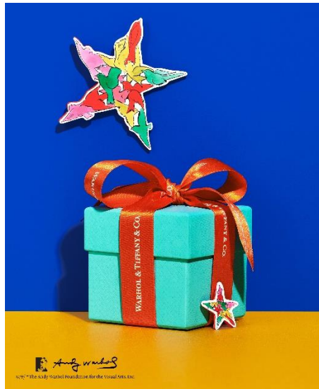
ホリデー限定のラッピング

お買い物いただいたお客様には、ウォーホルとティファニーのロゴがプリントされたオレンジ色のリボンと限定デザインのショッピングバッグで、特別なギフトを演出いたします。限定のショッピングバッグは、このポップアップストアをはじめティファニーの主要店舗でも同時にご用意しております。