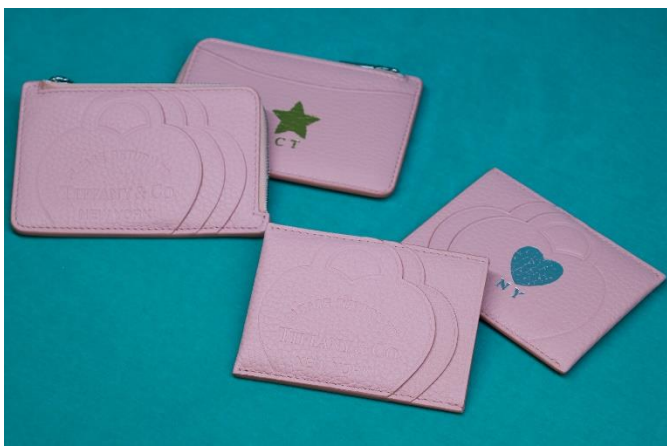
「リターントゥ ティファニー™」コレクション 左からジップカード ケース ¥48,950-税込 カード ケース ¥31,350-税込