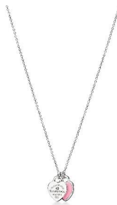
リターントゥ ティファニー™ ダブルハート タグペンダント シルバー ¥51,700-税込

お買い物いただいたお客様には、ウォーホルとティファニーのロゴがプリントされたオレンジ色のリボンと限定デザインのショッピングバッグで、特別なギフトを演出いたします。限定のショッピングバッグは、このポップアップストアをはじめティファニーの主要店舗でも同時にご用意しております。