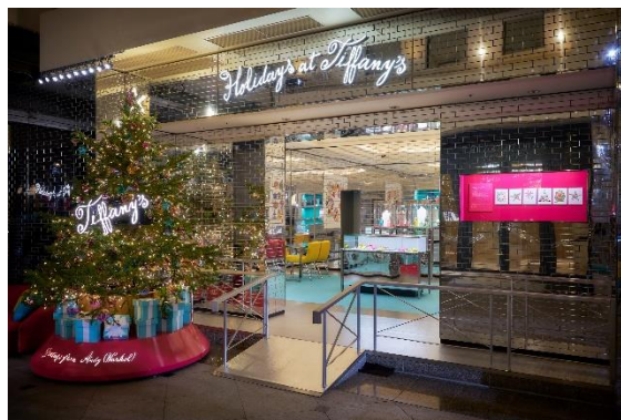
ポップアップストア

期間中、ティファニーの華やかなホリデーモードで彩られたカフェでは、ブランドのロゴをラテアートで表現したスペシャルドリンクやサンドイッチ、ケーキなどの様々な限定メニューと、エクスクルーシブな“ブレックファスト アット ティファニー” やランチ、ディナーをご用意しております。