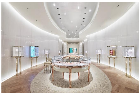
3F ブライダルフロア

店内の中心には、彫刻的なロッククリスタル素材の手すりか特徴の螺旋階段が設置されています。エルサ・ペレッティの官能的で有機的なフォルムにインスパイアされたこの階段は3階から8階を繋いでおり、各階へはエレベーターでも行くことができます。