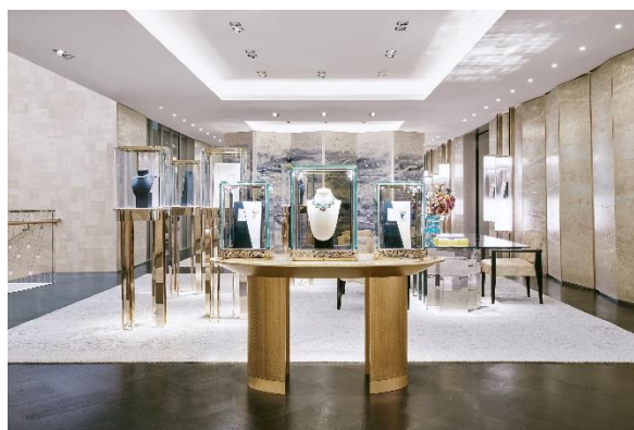
7F ハイジュエリー&ウォッチ フロア

For further inquiries, please visit press.tiffany.com .