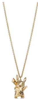
スモール 1,507,000 円 (税込)