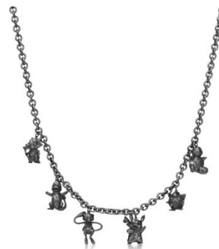
1,177,000 円 (税込)