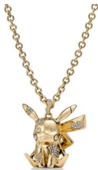
ラージ 4,730,000 円 (税込)