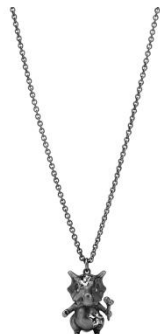
211,200 円 (税込)