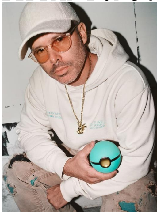
コンテンポラリーアーティスト ダニエル・アーシャム