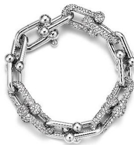
ティファニー ハードウェア リンク プレスレット パヴェ ダイヤモンド (ホワイトゴールド、ダイヤモンド) ¥12,650,000(税込)

ティファニーのアイコン「ティファニー ハードウェア」コレクションから、新たにネックレス5型、ピアス2型、プレスレット2型、リング2型が仲間入りいたします。ホワイトゴールドやイエローゴールドをベースとしたデザインは、ティファニーの卓越した職人たちによって、丁寧にセッティングされたパヴェ ダイヤモンドがアクセントを添えています。「ティファニー ハードウェア」は、反逆精神を心に秘めながら現代に生き、ハイファッションとストリートスタイルを掛け合わせ、オリジナルスタイルを持つ生きるニューヨークという街からインスピレーションを受け、生み出されました。艶やかなメタルと光輝くダイヤモンドが優美なコントラストを生み出し、ダイヤモンドの輝きを最大限に引き出します。