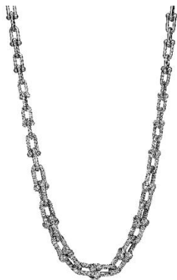
ティファニー ハードウェア グラジュエイテッド リンク ネックレス パヴェ ダイヤモンド (ホワイトゴールド、ダイヤモンド) ¥36,410,000(税込)