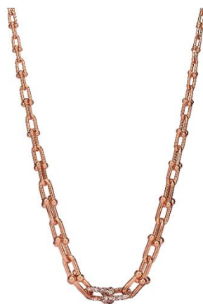
ティファニー ハードウェア グラジュエイテッド リンク ネックレス パヴェ ダイヤモンド (ローズゴールド、ダイヤモンド) ¥6,710,000(税込)