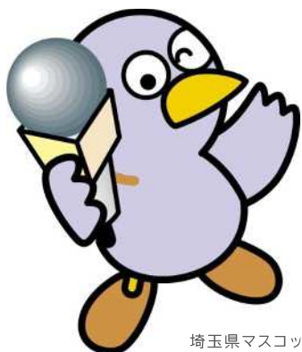
埼玉県マスコット コバトン