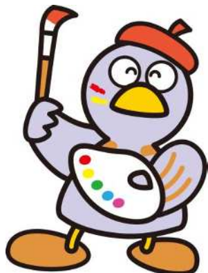
埼玉県マスコット コバトン