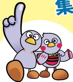
さいたまけん 埼玉県マスコット 「コバトン」「さいたまっち」

けん しまわ にほんいちく さいたまけん 県では、こどもの幸せにつながる日本一暮らしやすい埼玉県をつくるために、