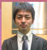
モデレーター 有限責任監査法人トーマツ さいたま事務所 マネジャー 公認会計士