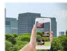
スマホをかざすと…