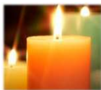
廃油でキャンドルナイト