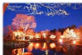
公園ライトアップ