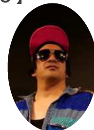
ポニーテールリボンズ