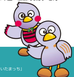
埼玉県マスコット「コバトン」「さいたまっち」