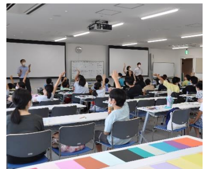
令和4年度の夏休み親子統計教室の様子

埼玉県県民健康センター 1階大会議室C (さいたま市浦和区仲町3-5-1) JR「浦和駅」から徒歩約15分、JR埼京線「中浦和駅」から徒歩約20分