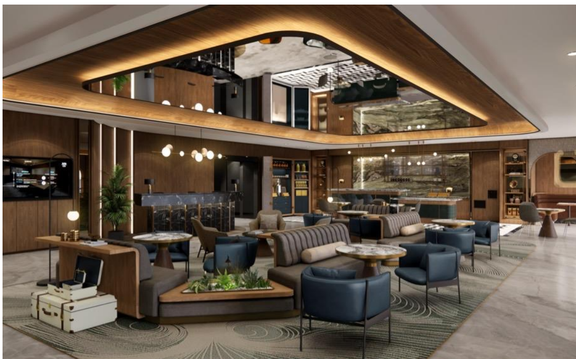
グラントラウンジ

THE COLLECTIVE GranTokyo South Tower, Tokyo (ザ・コレクティブ グラントウキョウサウスタワー, 東京)-WEB サイト: https://www.justcoglobal.com/thecollective/