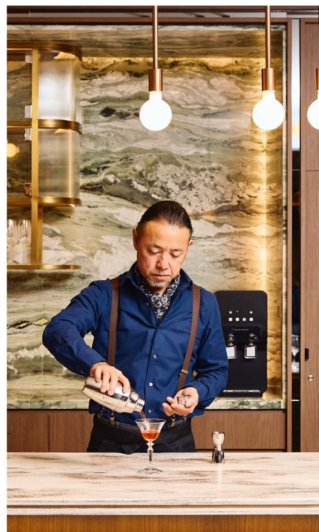
▲パントリー、モーニングリチュアル、アペリティフアワー