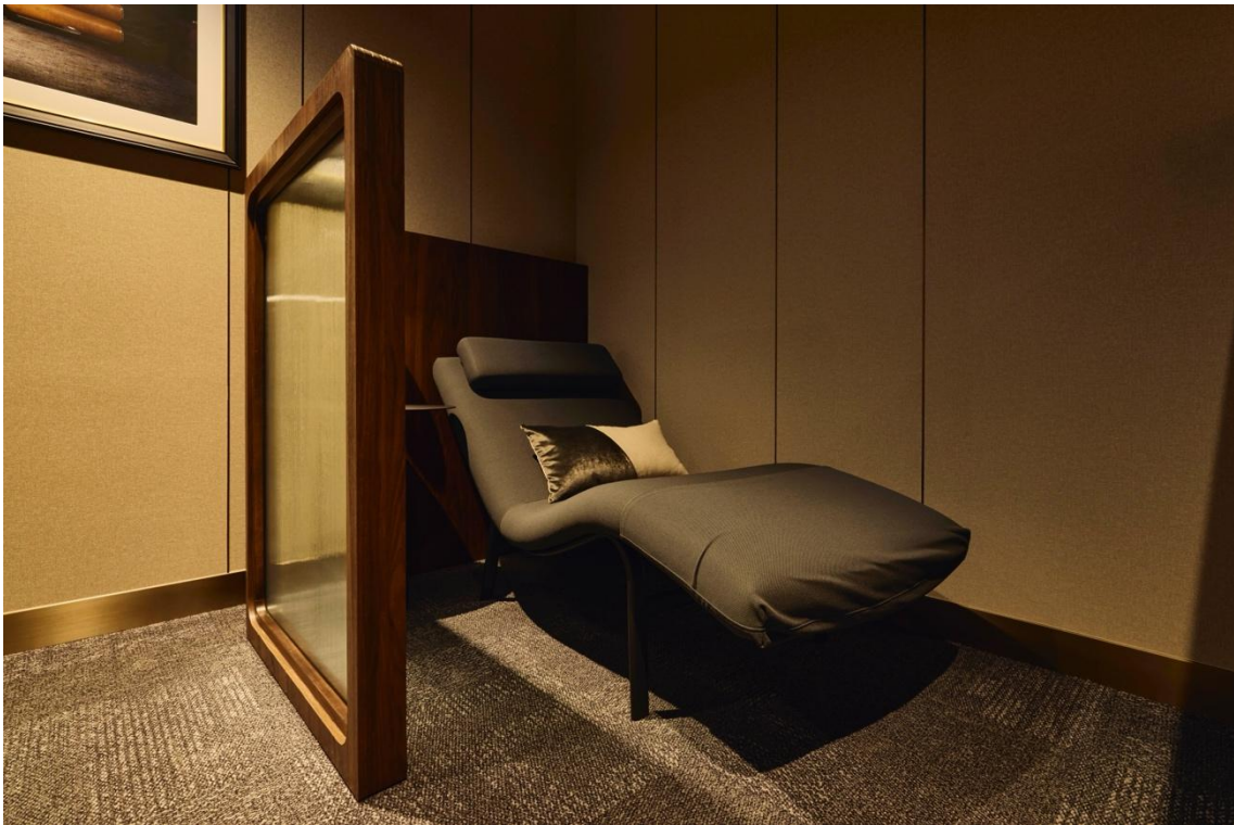
▲レストキャビン(ナップスペース)

「THE COLLECTIVE GranTokyo South Tower (ザ・コレクティブ グラントウキョウサウスタワー)」は、デザインからサービスまで、あらゆる面でご利用者様に極上のワークスペース体験をお届けするために作り上げたラグジュアリーコワーキングです。