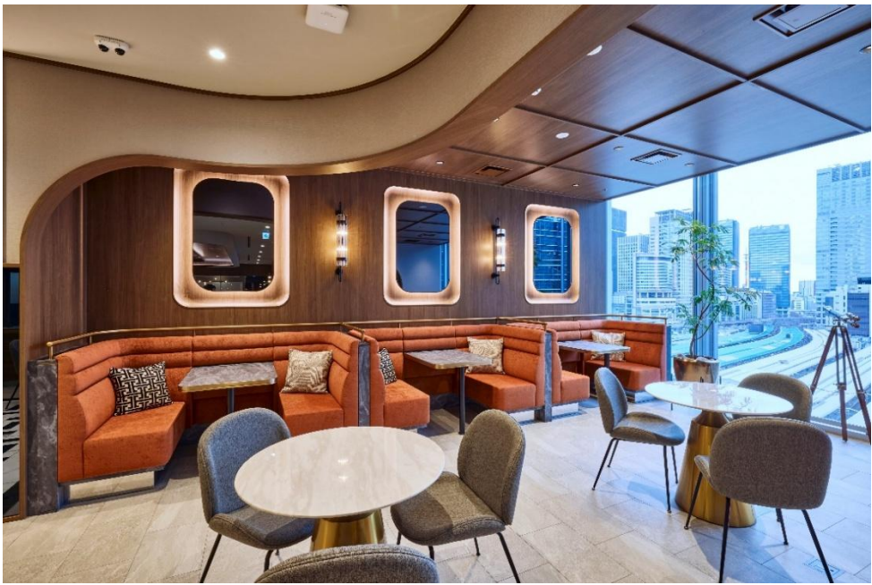
▲グランドラウンジ