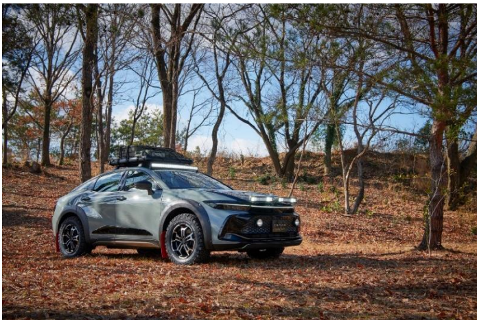
CROWN OUTDOOR CONCEPT ※当モデルは市販車ではございません。