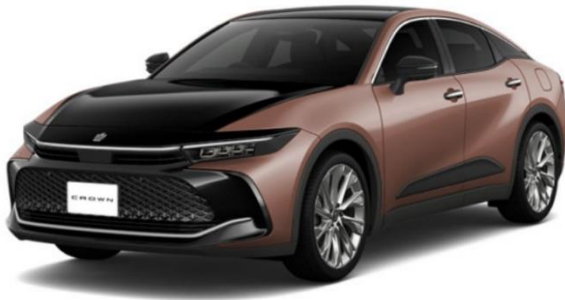
CROSSOVER G “Advanced・Leather Package”/ ブラック×プレシャスブロンズ