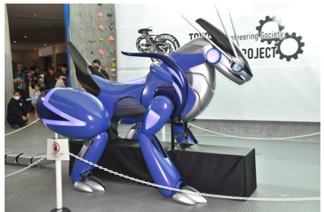
▲左「ドライブモード」、右「4足モード」