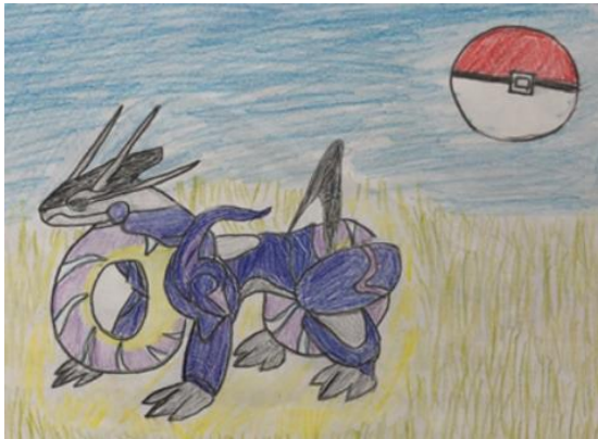
▲小学生が描いた「ミライモビリティ」

トヨタ技術会はトヨタ自動車内の有志団体です。1年の任期で任命された、技術の研鑽に興味を持つメンバーで組織されており、70余年の長い歴史があります。毎年、豊田市とトヨタ技術会との合同イベント「わくわくワールド」でその年のものづくり企画の成果物を展示するなど、技術の研鑽や地域貢献を通じて、トヨタ技術会の根幹とも言える「人と技術の力で開く未来」を追求している集団です。