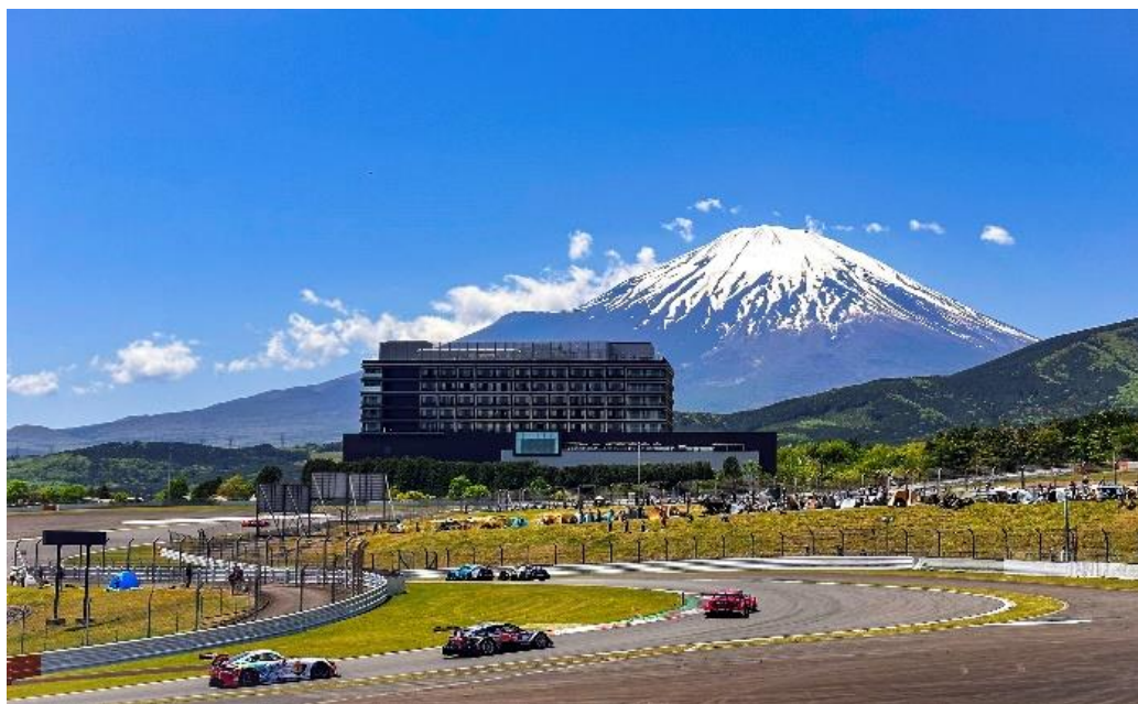
富士スピードウェイのメインサーキットでの試乗は富士山の眺めも魅力

2024 年 1 月に開催した Supra Winter Festival の参加者に対して実施したアンケートの中で最も多かった意見に応える形で実現した「サーキットでの乗り比べ」体験。日本を代表する国際サーキットのひとつ、富士スピードウェイのメインサーキットを、それぞれのスープラで先導車の誘導のもと 1 周ずつ走行します。公道では決して体験できない、スープラが持つポテンシャルを垣間見ることができる、唯一無二の体験となります。