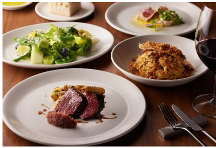
静岡の食の魅力を体感できるディナー