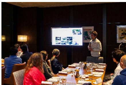
レストア担当者を囲む懇親会ディナー

宿泊日の夜には、4組の参加者が一堂に集まり、レストア担当者から貴重な裏話を聞ける懇親会ディナーが開催されます。TROFEO イタリアンの広々とした個室で、スープラのレストア過程や修復の苦勞について学びながら、静岡の食材を活かしたイタリアンディナーコースをお楽しみいただけます。同時に、他の参加者やトヨタのレストアスペシャリストとの交流を通じて、通常の試乗会にはない価値ある時間を提供します。また、滞在中には、富士大御神（おおみか）温泉でリラックスしたり、富士山の絶景を眺めながらの朝食ビュッフェや、ハイアットブランドならではのラグジュアリーなおもてなしによって、お連れの方も一緒に満足度の高い滞在をお過ごしいただけます。