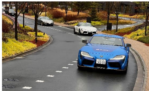
特別仕様の GR スープラが先導