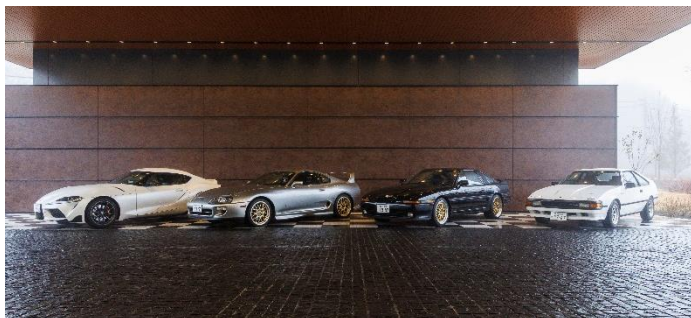
(左から) GR スープラ (MT)、80 スープラ、70 スープラ、セリカ XX

試乗会では、Vintage Club by KINTO でラインアップしている歴代のスープラ4台すべてに乗車することができます。それぞれの車を持つ個性を楽しむことができます。特に人気の高いセリカ XX 2000GT (1985 年式/MT) は、そのリトラクタブルヘッドライトと直列6気筒 DOHC エンジンが際立ち、時代を超えたスポーツカーの魅力を感じることができます。JZA70 型 スープラ 2.5GT ツインターボエアロトップ (1992 年式/MT) は、快適なドライブを提供し、80 スープラ (2002 年式/MT) は 20 年前の技術を超越した驚異的な性能を誇っています。伝統と革新が見事に融合した GR スープラ (2022 年式/MT) は、美しい音色を奏でるシルキーシックスエンジンと 6 速 MT が織り成す一体感が圧倒的です。これらの車両を、自然あふれるホテル周辺の公道で乗り比べし、スープラと共に時代の流れを辿ります。