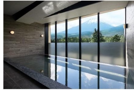
硫酸塩泉の自家源泉と富士山を望む温泉