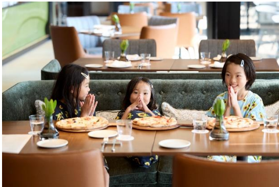
年の離れた兄弟でも一緒に楽しめる