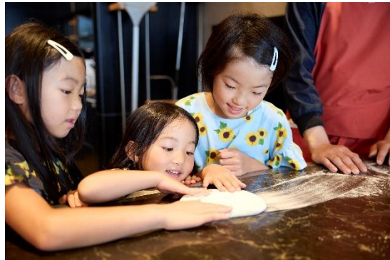
ピザ生地に触れて伸ばすのも体験できる