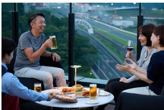
サーキットの絶景が楽しめるビアガーデン