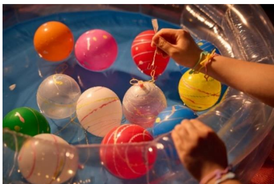
年齢を問わず楽しめるヨーヨー釣り

2024年7月21日（日）から8月31日（土）まで、ビアガーデンと同じ会場にてお子様も楽しめる「ルーフトップ夏祭り」を開催いたします。輪投げやヨーヨー釣りなどの3つのゲームが用意され、お菓子やホテルの非売品オリジナルグッズなどが景品として提供されます。ファミリー全員で楽しみながら夏の思い出を作る絶好の機会ですので、ぜひ足をお運びください。