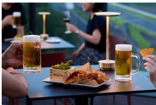
おつまみの盛り合わせが付いた 90 分の飲み放題制