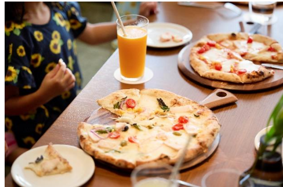
ソフトドリンク付きでパーティー気分を味わう