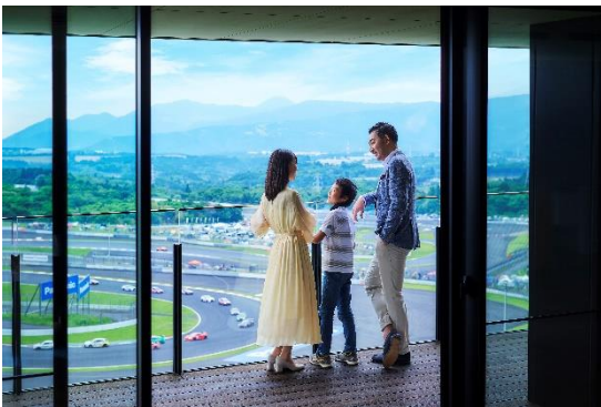
サーキットビューGPスイートルーム

夏の思い出作りをさらに楽しくアップグレードする夏限定の宿泊プラン「サマーキッズジャーニー2024」が、7月13日（土）チェックインより8月31日（土）チェックアウトまでの期間にご利用いただけます。特典として、小学生以下のお子様にごプレゼントされる「キッズパスポート」を使用すると、ホテル館内の対象店舗でアイスクリームとソフトドリンクを無料でお楽しみいただけます。また、レンタルカート体験の割引や、富士サファリパークの優待料金もご利用いただけます。ご夕食には、大人の方には「TROFEO イタリアン」の5品のコースディナーを、小学生のお子様には3品のセットメニューをご用意しております。さらに、屋内プールや温泉を満喫し、ぐっすりとお眠りについた次の日には、富士山の絶景を楽しめる豊富な和洋のメニューが取り揃えられた朝食ビュッフェをお楽しみいただけます。また、滞在記念としてホテルオリジナルのマグネットもプレゼントいたします。家族全員が楽しめるこのプランで、充実したバケーションをお過ごしください。