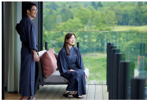
ホテルオリジナル浴衣