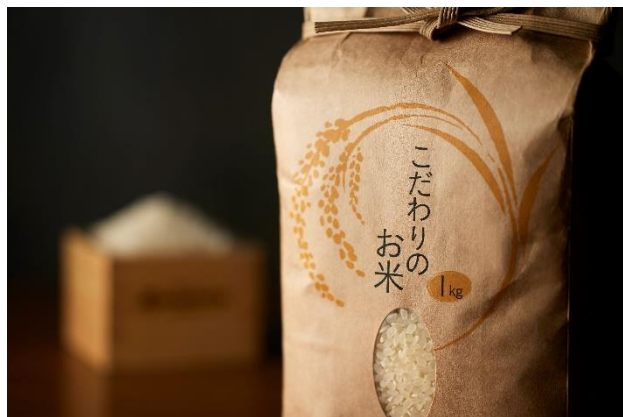
ごてんばこしひかり 1kg

この夏はぜひ、地元農家の想いが詰まったお米と富士山麓の恵みを味わい、ご家庭へとお持ち帰りください。その“おいしい記憶”が、またこの地を訪れるきっかけとなることを願っております。