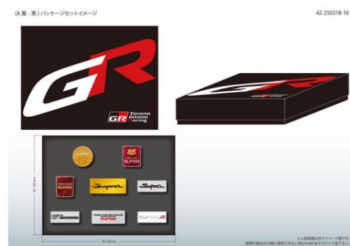
ノベルティのイメージ