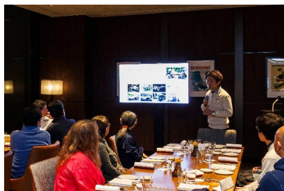
懇親会のイメージ

当日は、参加者 12 組が一堂に会し、Vintage Club by KINTO の担当者によるここでしか聞けない“スープラの裏話”を楽しむ懇親会ランチを開催します。会場は、富士山の絶景を望む広々とした「TROFEO イタリアン」の個室。静岡の厳選食材を使用したランチコースを味わいながら、ハイアットならではの洗練されたおもてなしをご堪能いただけます。