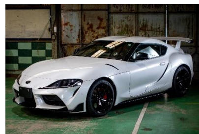
GR スープラ by TOM'S × KINTO