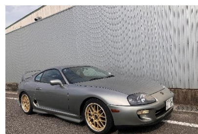
スープラ RZ (JZA80)