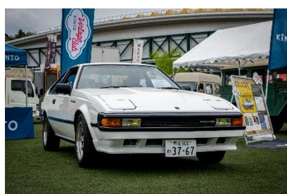
セリカ XX 2000GT (GA61)