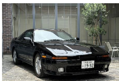
スープラ 2.5GT ツインターボ (JZA70)