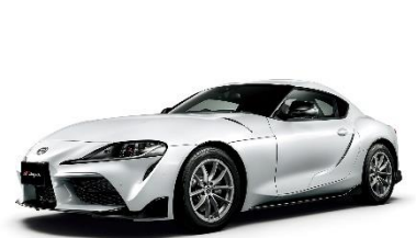
GR スープラ (2019 年式／AT／RZ)