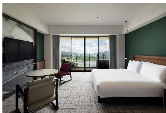
サーキットビュー キング

本イベント参加者は、イベント前日または当日のご宿泊を対象に、通常料金から 20% オフの特別宿泊プランを任意でご利用いただけます。サーキットビューや富士山ビューの客室での滞在に加え、富士大御神温泉での癒しや、炉端焼き・イタリアンレストランでの上質なディナー、さらにホテル館内のレーシングシミュレーター体験も楽しめる、旅行を兼ねた特別な休日ぜひこの機会にご満喫ください。