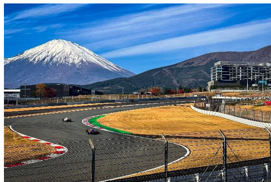
富士山の眺めも魅力のメインサーキットでの試乗

本イベントの最大の魅力は、富士スピードウェイのメインサーキットでの試乗体験です。国際規格を誇る全長約 4.5km のコースを舞台に、先導車に従いながら一組あたり 4 車種を 1 周ずつ走行。公道では決して味わえない、スープラの潜在能力を解き放つ瞬間を体感できます。富士山を望むサーキットで、名車の鼓動を感じる贅沢な時間をお楽しみください。