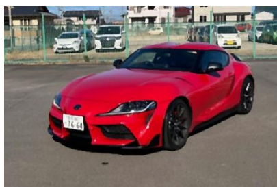
GR スープラ (2025 年式／AT／RZ)