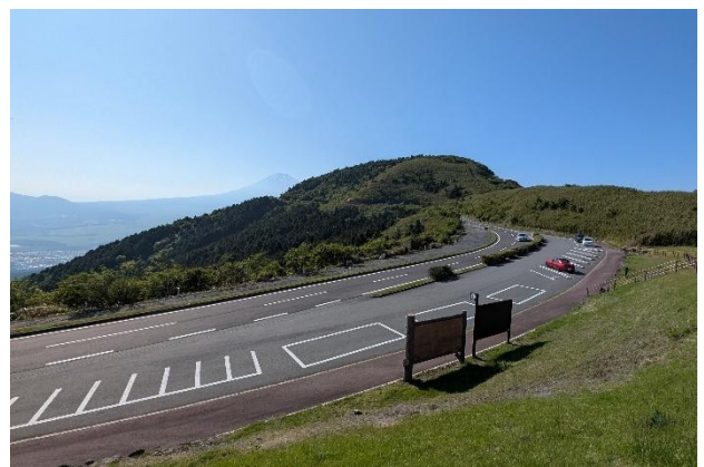
芦ノ湖スカイライン