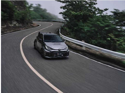
GR ヤリス Aero performance package

5月1日～12月31日の期間に試乗車として登場するGRヤリス Aero performance package は、ダクト付きアルミフードやフロントリップスポイラー、フェンダーダクト、可変式リアウイングといった、スーパー耐久シリーズや全日本ラリー選手権などモータースポーツからの学びを生かした6つの専用空力パーツが、従来のGRヤリスでは得られない高い安定性・冷却性・ステアリング応答性をもたらすことで、公道での走りそのものをワンランク上の体験へと引き上げてくれます。これらのアップデートは本来サーキットやラリーのために磨かれた技術ですが、街中のコーナーやワンディングでも「クルマが自分の手足のように反応する」感覚を日常速度域で実感できる点こそが、このパッケージの大きな魅力です。