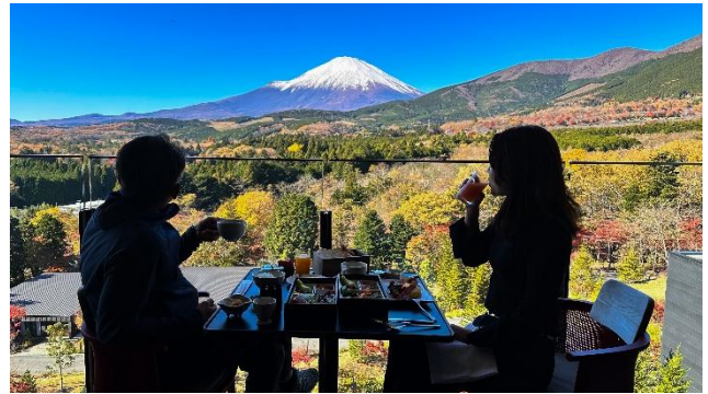
客室からの圧巻の富士山ビュー

さらに、離れに位置するヴィラは約 143 m 2 以上の広さを誇り、リビング、ダイニング、キッチン、プライベートテラスを完備。ショーガレージ付きのため、愛車を眺めながら過ごす贅沢なひとときをお楽しみいただけます。