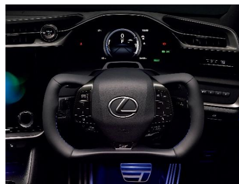
RZ550e “F SPORT” ステアバイワイヤシステム