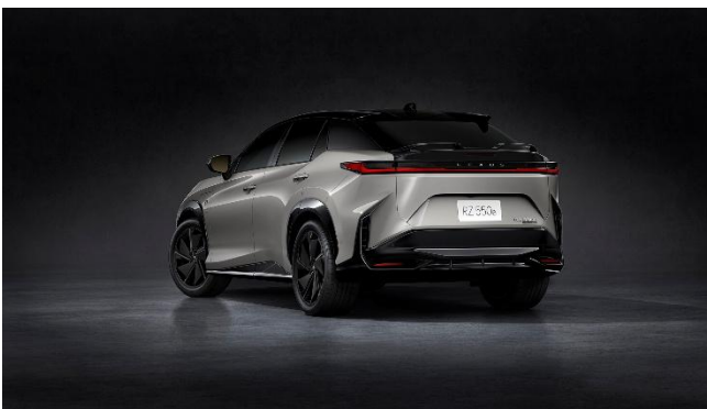
RZ550e “F SPORT” エクステリア

6月20日～12月31日の期間に試乗車として提供される LEXUS RZ550e “F SPORT” は、402 馬力のデュアルモーターと DIRECT4 四輪駆動が生み出す圧巻の加速力と高い走行安定性によって、ハイパフォーマンス BEV であることを瞬時に感じさせながらも、制御の緻密さによって過剰な刺激ではなく「品格あるダイナミズム」を感じられる車両となっています。また、ドライバーの意図に忠実なコントロールを可能にしたステアリング性能とステアバイワイヤシステムも注目。その走りは、快適さと上質さを兼ね備えた室内空間と組み合わせることで、独自のラグジュアリーパフォーマンスを体現します。