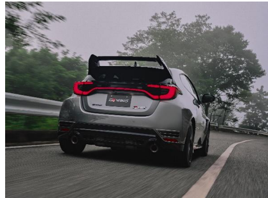
6つの専用空力パーツを感じられる走り