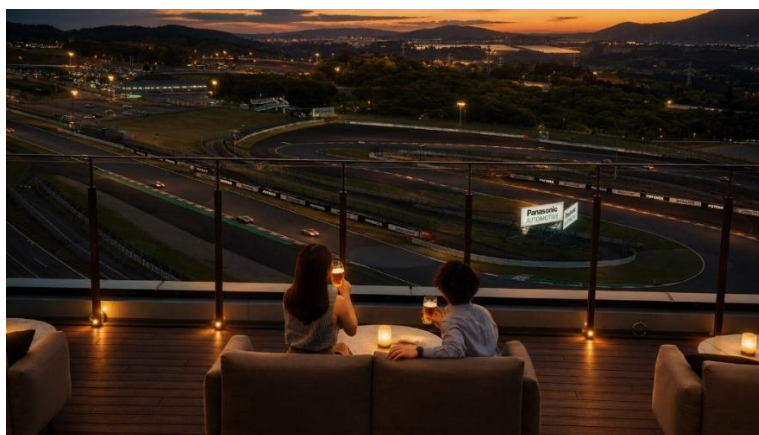
富士スピードウェイを一望するルーフトップテラス (イメージ)

ホテル最上階のルーフトップテラスでは、毎夏ご好評をいただいているビアガーデンを開催いたします。富士山と富士スピードウェイを同時に眺められる開放的なロケーションで、ここでしか出会えない特別な夏のひとときをご提供いたします。