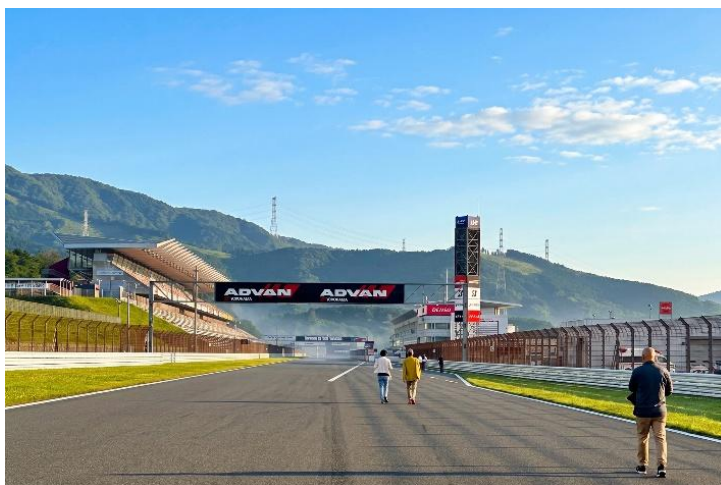
終わりが見えないほど長いストレート

富士スピードウェイホテルでは、普段徒歩では入ることができない国際サーキットの本コースを歩く早朝ウォーキング体験を宿泊者に提供いたします。静寂に包まれたサーキットは、普段のレース時とはまったく異なる表情を見せ、非日常のひとつときへと誘います。コース上を歩きながら記念撮影をお楽しみいただけるほか、縁石やアスファルトの表面に刻まれたタイヤ痕を通して、モータースポーツの歴史が刻んだ名場面のレガシーに直接触れられます。やがて全長 1,475m のホームストレートに立てば、その圧倒的なスケールと、かつてここで繰り広げられた躍動と歓声の余韻を肌で感じるはずです。この体験でしか得ることのできない静けさと高揚が交差する特別な時間を、ぜひご体感ください。