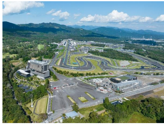
ホテルはサーキットに隣接してアクセス良好