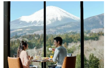
富士山の絶景を誇るレストラン