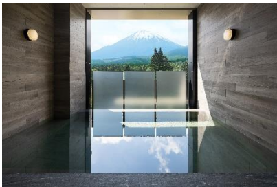
半露天風呂付きの富士大御神温泉

お食事やスパトリートメントは、ホテルにご宿泊でない方もご利用いただけますので、この機会を使ってスピードウェイからお気軽にお立ち寄りください。