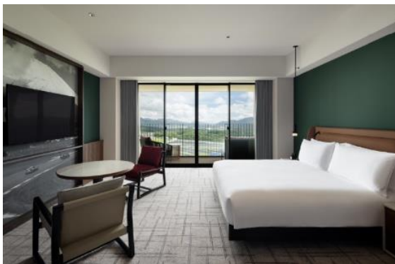
サーキットビューキングルーム

また、レース期間中にはホテルの駐車場（P14）と富士スピードウェイの間のゲートが解放され、レース観戦券を所持している方は自由に行き来することが可能となります。ゲート脇には富士スピードウェイ内を巡回する無料シャトルバスが停車するため、イベント広場やグランドスタンドへ快適にアクセスすることができます。