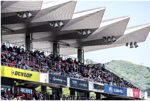
本プランではグランドスタンド2階席を確約