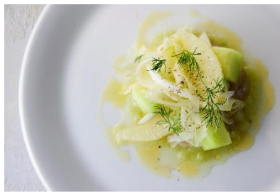
静岡県産食材にこだわった食事