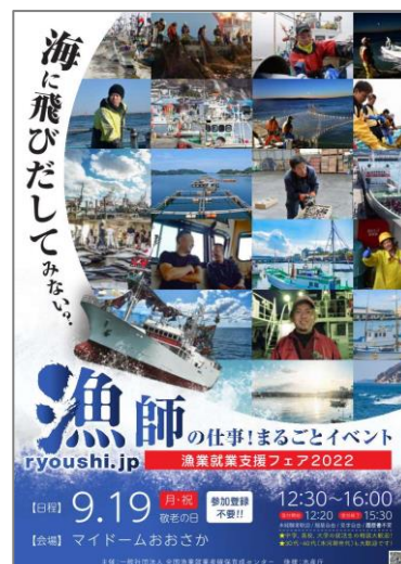
漁業就業支援フェア 2022 大阪ポスター

主催:一般社団法人全国漁業就業者確保育成センター 後援:水産庁 協力:くら寿司株式会社