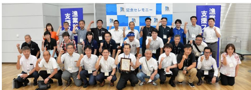
セレモニー終了後に開催される漁業就業支援フェアで漁師を募集する皆さんと記念撮影