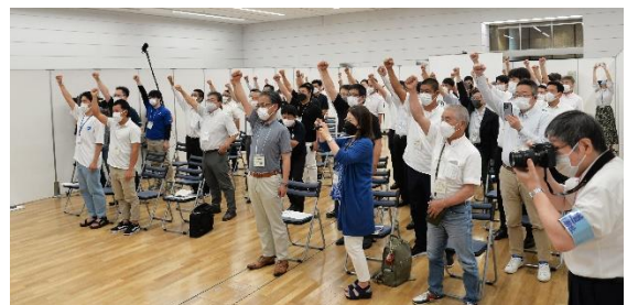
漁師希望の大学4年生からメッセージ セレモニーのしめには三重県熊野漁協所属 定置網の親方の合図で 関の声「エイエイオー！」