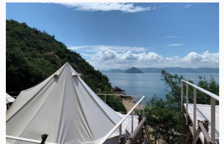
※サイトの目前に浮かぶ大槌島