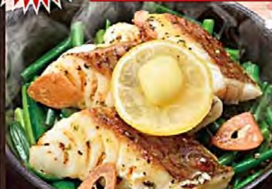
Lemon Pepper Grilled Cherry Red Sea Bream with Leek 香葱柠檬胡椒櫻鯛鉄板焼 [미야자키현산] 레몬 케피 구이

20% OFF クーポン 対象商品! [20%OFFクーポンについて] ※下記のいずれかをお会計時にご提示ください。 ●エポスカード会員限定クーポンを持参 (お会計はエポスカード払いが条件) ●当社モバイル会員限定メルマガクーポンご提示 ●当社SNS公式アカウントクーポンご提示 [対象の当社SNS 公式アカウントクーポン] LINE@