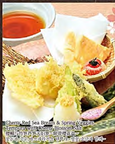
Cherry Red Sea Bream & Spring Veggies Tempura with Cherry Blossom Salt 桜鯛と山竹第2種野菜天婦羅(附帯桜花塩) [宮崎県産] 桜鯛と山竹第2種野菜天婦羅(附帯桜花塩) [미야자키현산] 참돔과 봄야채 튀김과 핑크소금과 향이

12 アスパラ、筍の山の幸とともにどうぞ。 桜鯛と山の幸二種の 炙り焼きびたし 480円(税抜)