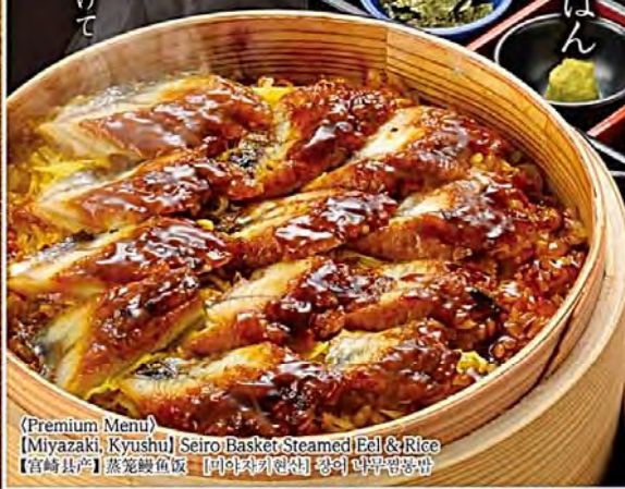
(Premium Menu) [Miyazaki, Kyushu] Seiro Basket Steamed Eel & Rice [宮崎県産] 蒸籠鰻魚飯 [미야자키현산] 향이 밥무림용담