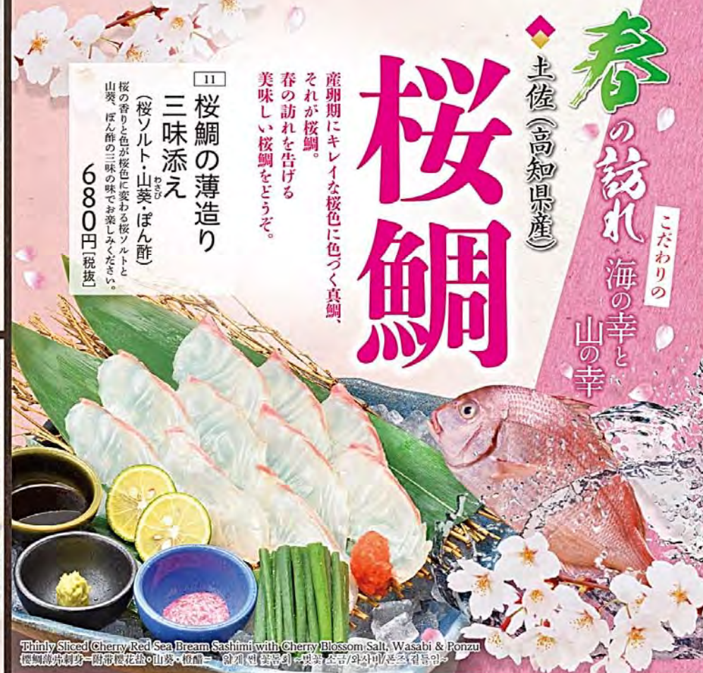
Thinly Sliced Cherry Red Sea Bream Sashimi with Cherry Blossom Salt, Wasabi & Ponzu 桜鯛刺身おろし(附帯桜花塩・山葵・桜餅) - 香い(附帯) 醤油とわさびとポン酢がけ

産卵期にキレイな桜色に色づく真鯛、 それが桜鯛。 春の訪れを告げる 美味しい桜鯛をどうぞ。