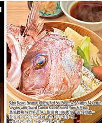
Seiro Basket Steamed Cherry Red Sea Bream & 2-Variety Mountain Veggies with Grated Daikon Radish, Salted Plum & Ponzu 蒸籠鰻鯛と山竹第2種肉類肉類添え(附帯桜餅) [宮崎県産] 蒸籠鰻鯛と山竹第2種肉類肉類添え(附帯桜餅) [미야자키현산] 참돔과 두산의 산초와 라이스 푸이 -향이 밥무림용담-