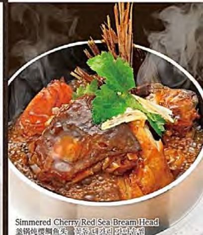
Simmered Cherry Red Sea Bream Head 釜鍋焼鯛魚頭 [미야자키현산] 참돔머리찌개

41 桜鯛のねぎレモン ペッパー焼 780円(税抜) ※ソースにお酒を使用している為、お子様や お車を運転される方は注意ください。