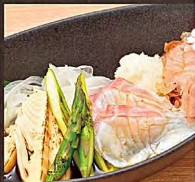
Grilled Cherry Red Sea Bream & 2-Variety Mountain Veggies in Sauce 桜鯛と山竹第2種野菜添え(附帯桜餅) [宮崎県産] 焼鯛と山竹第2種野菜添え(附帯桜餅) [미야자키현산] 구운 참돔과 두산의 산초와 라이스 푸이 -향이 밥무림용담-

12 アスパラ、筍の山の幸とともにどうぞ。 桜鯛と山の幸二種の 炙り焼きびたし 480円(税抜)