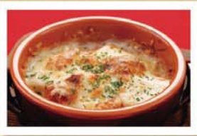
熱々/ダブル豆腐グラタン