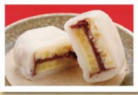
熊本のお茶菓子 いきなり団子