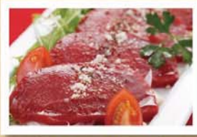
馬刺のカルパッチョ