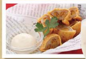
からし蓮根のひと口揚げ