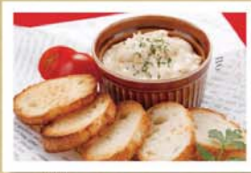
秘伝豆豉&チーズのバケットディップ