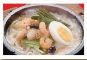
野菜たっぷりヘルシー石鍋太平煮