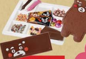
デコ菓子 くまモンバージョン