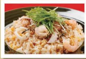
豚骨塩釜のし〜御飯の友たっぷりがけ〜