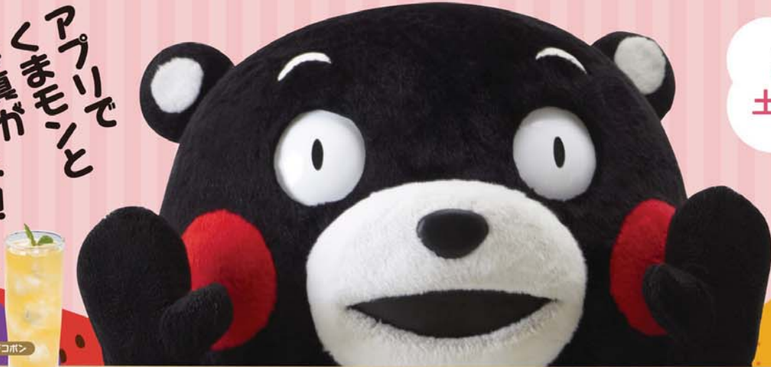
真/ファジーデコボン