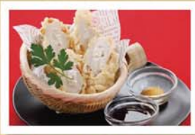
熊本新名物 / ちくわサラダ