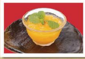
熊本特産 さつぱりデコボンゼリー