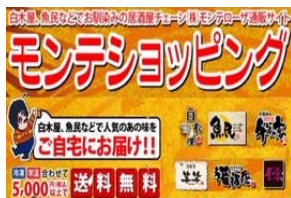
モンテショッピング