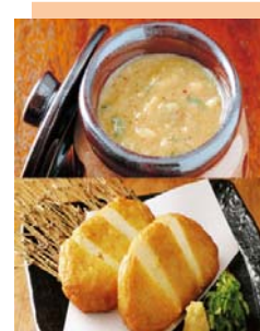
(商品例) 山内農場のなめ味噌とつけあげセット

当社店舗のプライベートブランド商品や「おせち3段重」、有機野菜、馬刺し食べ比べセット、越後の米農家直送新潟米、一味違う栗醤油、信州の味噌屋が送るトマト味噌、養鶏場からは「卵」や「プリン」、お茶専門店、下関からお届けする「のどぐろ」「あんこうの“い”」の加工品など、こだわりの食品を取り揃えています。