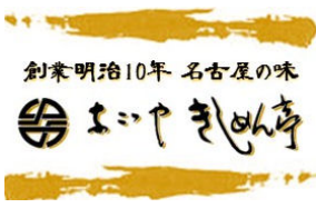
なごやきしめん亭