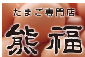
たまご専門店熊福