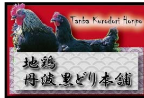
地鶏丹波黒どり本舗